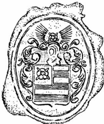
Fig. 4. — Sceau des de Blier, apposé sur des documents émanant de membres de cette famille entre 1780 et 1792 : (d'argent) à trois fascés (d'azur) au franc-quartier (d'or) chargé d'une rose (de gueules) boutonnée (d'or) barbée (de sinople). Ech. : 2/1. (Dessin de M. J. Bernard.)

Dans l'entre-temps, Cymont avait négocié avec les représentants de Wernart d'Oostfrize, le dernier seigneur engagiste à qui on avait repris la seigneurie. Ces représentants avaient tergiversé : ils réclamaient qu'on leur versât des florins d'or et non des florins de 28 sols et les 4.000 florins accordés pour la réparation du château. Le S r de Tilly et les héritiers du Vicomte de Dave, les beaux-frères de Wernart, s'étaient abstenus de comparaître.